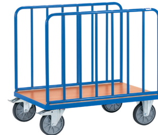
2571 / 2572 / 2573

Altura das guardas: 600 (até laminado) / 750 mm (total) Larg. útil = larg. plataforma - 60 mm