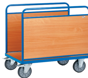
2541 / 2542 / 2543

Altura das guardas: 600 (até laminado) / 750 mm (total) Larg. útil = larg. plataforma - 60 mm