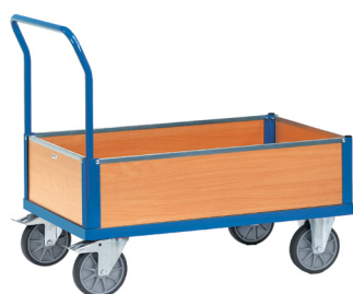
2560 / 2561 / 2562 / 2563