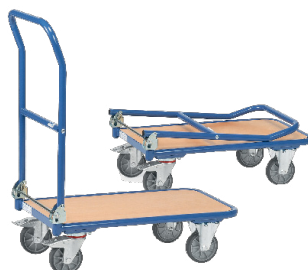
1132 / 1154

Rebatível. Construção em tubo de aço soldado. Plataforma revestida a laminado de madeira