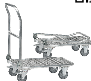
1133 / 1134

Rebatível. Construção em tubo de aço soldado. Plataforma revestida a laminado de madeira, acabamento em cinza antracite