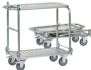
1180 / 1181

Rebatível. Construção em tubo de aço soldado. Prateleiras revestidas a laminado de madeira Capacidade de carga da prateleira superior: 80 kg