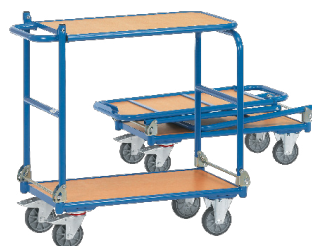
1140 / 1141

Rebatível. Construção em tubo de aço soldado. Prateleiras revestidas a laminado de madeira Capacidade de carga da prateleira superior: 80 kg