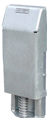
BUMO 1151 galvanizado