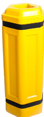
Art. nº CP150