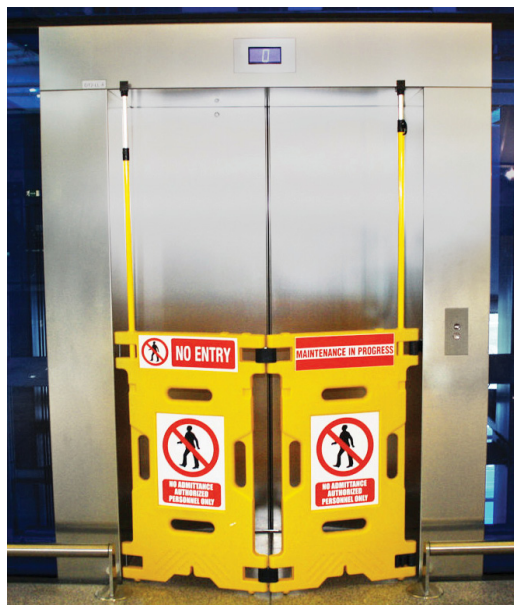
Baia na marcação de elevador em manutenção