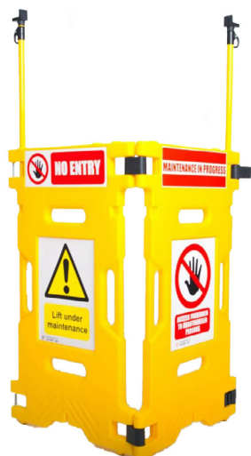
Art. nº ELE1

As Guardas para Elevador constituem uma solução rápida e económica, desenhada especificamente para assinalar e bloquear a entrada em elevadores durante a sua manutenção.