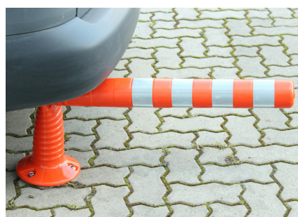
Flexibilidade do material permite inclinação num raio de 360°