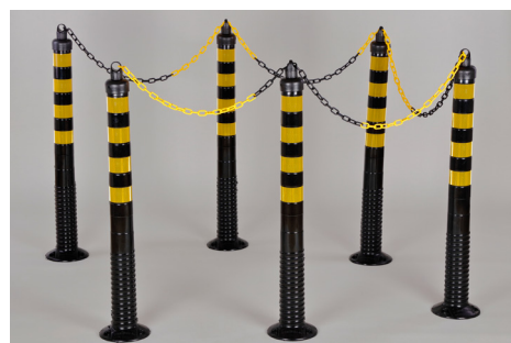
Art. nº SET-FP-GS-1000