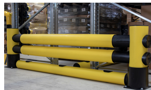
“Mike” + “Golf”