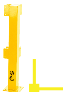
4x Poste de canto 90°