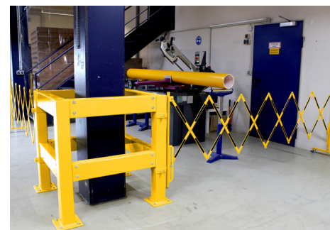
Combinação Protetor para Colunas + Barreira Extensível