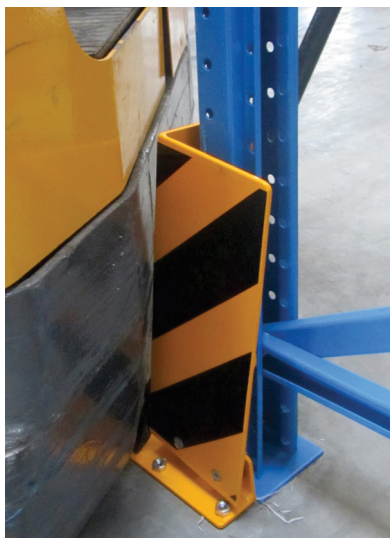
Art. n° 477.89BG Flexível