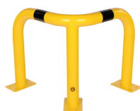
40-20(-) / 40-20