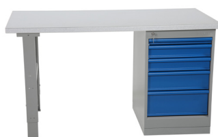
743343 / 743353 Alumínio