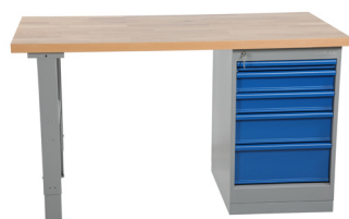
743342 / 743352 Carvalho