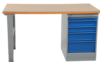
743341 / 743351 Impermeável