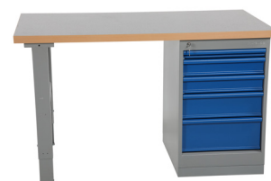
743344 / 743354 Vinil